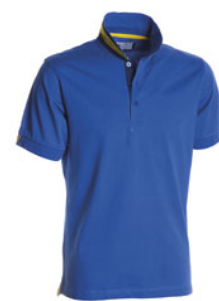
BLU ROYAL/GIALLO-BLU NAVY